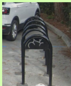
Arceaux vélo basse et moyenne corniches