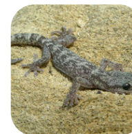
Phyllodactyle d'Europe (Tarente de Mauritanie)

Explorez les plus beaux jardins de France. Parmi eux, retrouvez le jardin botanique Saint-Michel de Villefranche-sur-Mer.