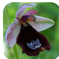
Ophrys de Bertoloni

Ce parc de 712 hectares , s'étendant du Mont Leuze au Mont Bataille , se situe sur des plateaux calcaires avec des paysages sculptés par l'érosion, comme des grottes et des dolines. Réparti sur les communes d' Eze, La Trinité, La Turbie et Villefranche-sur-Mer , il abrite une végétation typique des écosystèmes littoraux des Alpes-Maritimes , avec 450 espèces de végétaux, dont certaines protégées et endémiques, comme la nivéole de Nice. Le parc est également un site d'observation de grands rapaces et l'un des rares abris du phyllodactyle d'Europe (gecko nocturne mesurant entre 10 et 15 cm, doté de doigts adhésifs, vivant principalement autour du bassin méditerranéen, dans des environnements rocheux et urbains).