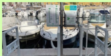
Recharge vélos électriques