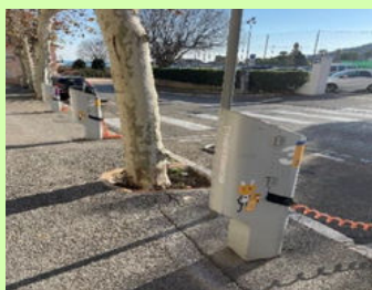
Avenue Général de Gaulle