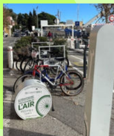
Arceaux + Air Vélo (Darse)

Mise à disposition sur le territoire de la commune d'un accueil, de services et d'infrastructures spécifiques adaptés aux besoins des touristes à vélo.